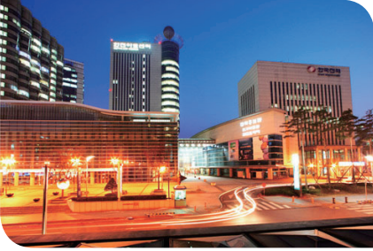
▶ 서울(양재 한전 아트센터)